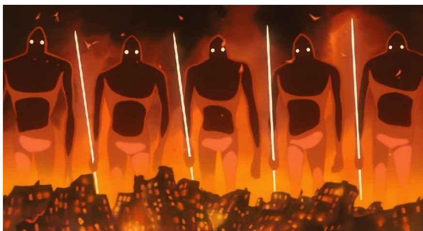
圖三：終極生化武器「巨神兵」毀滅世界的戰爭圖（動畫 00：30：52）

在情節設定上，超級大國突然攜帶大批破壞性武器巨神兵殺進非武裝化的小國「風之谷」。此處解讀為關於戰後日本軍備以及核問題的「寓言」。(大塚英志, 2012) 巨神兵在此象徵了「生化武器」，代表了國家背後的權力，在此也可看出宮崎駿的反戰意識，這按照拍攝《風之谷》的年份算起，在當時戰後的日本，群眾驚恐於核電站的輻射能，因此有了反核電的舉動。而在《風之谷》中，人們也因為使用巨神兵這樣太過強大的武器，導致了世界的毀滅，以及後續的環境和生態汙染，讓人無限唏噓，見圖三。