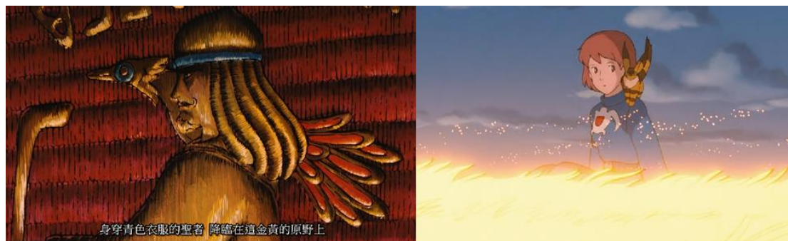
圖二：開頭官邸預言刺繡與結尾娜烏西卡被王蟲救起比對圖片（動畫 00：20：48 與 01：52：44）

在「預言」這個部分，在動畫中有瞎眼的祖奶奶預言（00：20：48）：「身穿青色衣服的聖者，降臨在這金黃的原野上，重繫已經和大地失去的羈絆，最終引導人們前往藍色清淨之地。」此象徵現實生活中的「新聞媒體」，對環境汙染做出警告或相關報導，最後由於祖奶奶雙目失明，所以由風之谷的小女孩們現場轉播王蟲大舉奔向風之谷的情形，證實娜烏西卡就是偉大救主。為了讓娜烏西卡能夠呼應預言，也特別安排在一開場出現的小胡松鼠，讓它一直待在那烏西卡肩上，最後在王蟲的觸鬚上，剛好印證了預言的畫面，見圖二（01：52：44）。祖奶奶也象徵平時聽信預言後，「聽天命」不知變通的人們，畢生固執地守護某些傳說或是聽信某些報導，但沒有實際去求證的人們。