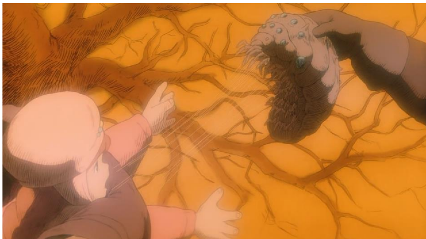
圖四：小時候的娜烏西卡被迫與王蟲分離(動畫 01:01:44)

自然生態的重要。(簡文爵、林瑞玉與吳幸娥，2010)。而在動畫中特別在第二次童音哼唱時，出現娜烏西卡童年時與王蟲的約定(01:01:44)，就可得知娜烏西卡從小就已對王蟲友善，且能與王蟲溝通，但人們顯然非常不以為意，甚至討厭娜烏西卡與小王蟲往來，儘管娜烏西卡盡全力想保護小王蟲，但依然被家人強行帶離，並告知娜烏西卡：「蟲和人是不能生活在同一個世界的。」娜烏西卡說：「不！他並沒有做什麼壞事！」用孩子的角度去詮釋「大自然本身並沒有錯」這件事情，並用最純真，最質樸的口吻再問人類：「為什麼？為什麼要這樣迫害環境？」而在最後王蟲救起已死去的那烏西卡時，也重覆撥放了童音哼唱的小調，再強調一次小時候與王蟲的約定。