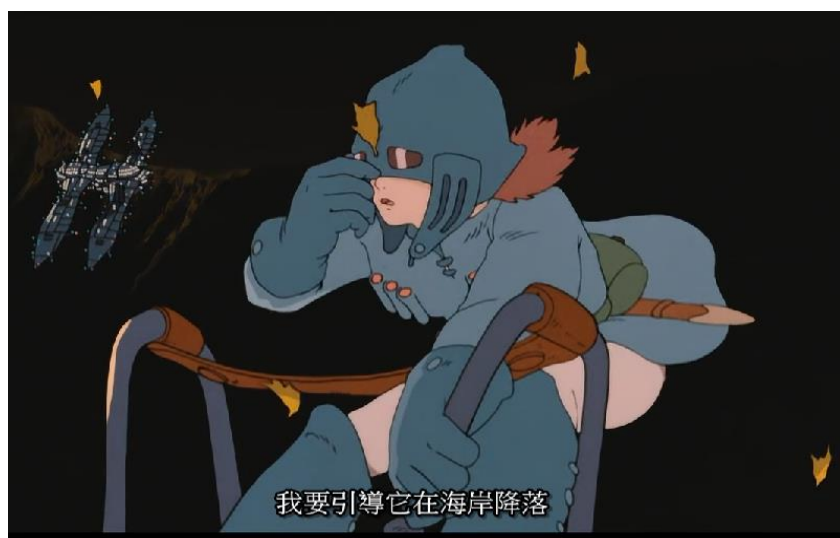
圖一：娜烏西卡穿著飛行戰鬥裝備（動畫 00：23：21）

在服裝的設計上，貴為公主，娜烏西卡沒有穿著漂亮衣服也沒有華麗的綴飾，而是穿著飛行戰鬥裝備（00：23：21），背著槍砲、火藥、蟲笛，到處尋找治療族人怪病的方法，和許多人記憶中形象的公主大不相同，如圖一。