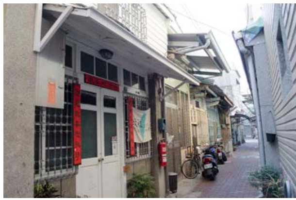
圖 3 屎溝墘客廳