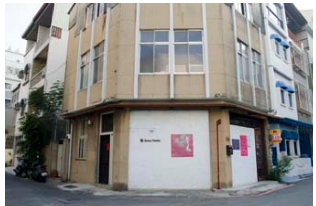
圖 6 鳳凰特區