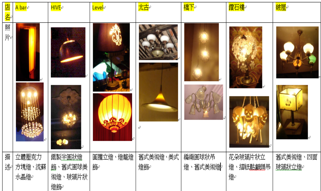
表 6 門面分析表