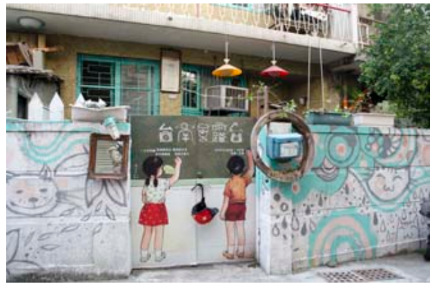
圖 4 小露臺