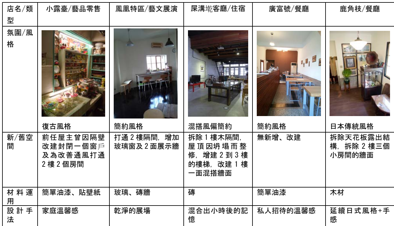
表 3 「老屋欣力」實質空間分析表

在實質空間調查上以立意抽樣選擇小露臺、鳳凰特區、屎溝墘客廳、廣富號、鹿角枝 5 家「老屋欣力」店家進行包括氛圍/風格、新舊空間、材料運用、設計手法的分析。