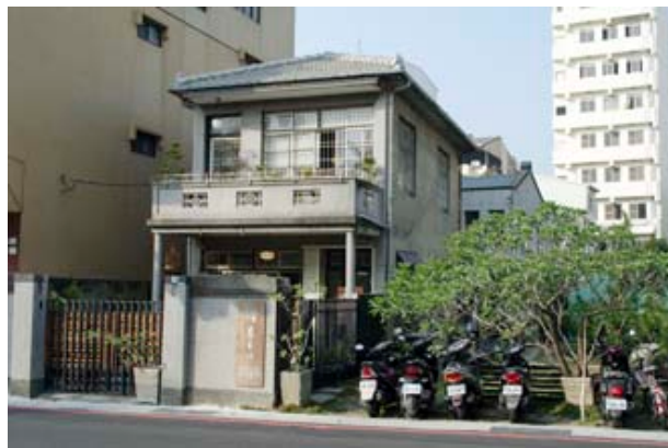
圖 5 鹿角枝