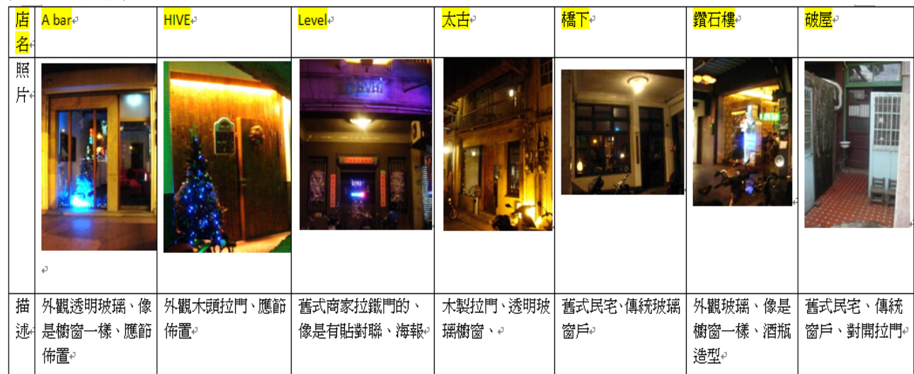
表 5 門面分析表

A bar 的是像玻璃櫥窗有應節的擺飾藍色的微光營造出氣氛；HIVE 的是整面以木頭拉門為特色上排有微光打出，門旁有應節的擺飾與佈告欄；Level 的是舊式的上下鐵拉門會貼上春聯，兩旁有鐵窗也會貼上活動的海報；太古的是兩旁玻璃櫥窗有擺飾古董飾品，中間為木製拉門；橋下的是舊式民宅有大片的傳統玻璃窗戶，旁有木頭的長座椅；鑽石樓的是整片為玻璃櫥窗擺置出現代酒瓶造型與復古元素小物；破屋的是如同回到鄉下民宅的感受，傳統對開式木製拉門上面有玻璃窗戶鐵架有斑駁歷史的痕跡(表 5)。