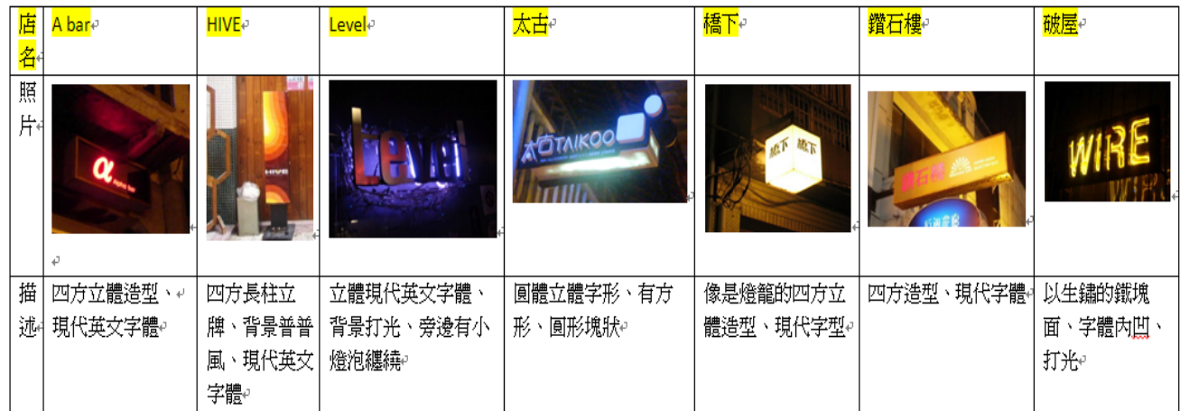
表 4 招牌分析表

上去的海報，有不規則形狀的圖案與店名；Level 的是銀色的立體字，背景有紫色的微光打出，字體的周圍有小燈泡纏繞是個特色；太古的是比較趣味可愛的字體，造型也較特別；橋下的是四角的正方體，亮燈時整個很明亮，像是燈籠；鑽石樓的是土黃底色，字體為粉紅色，不顯眼；破屋的是以自然生鏽的鐵片字體鏤空從後面打出亮光，使得招牌更加有懷舊感(表 4)。