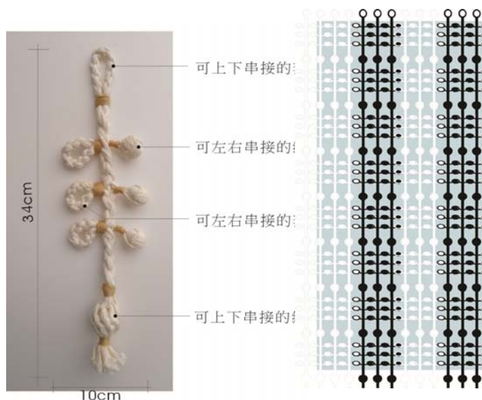
圖 3 設計單元及組合示意圖（作者自行整理）

為呈現將編結使用在現代工藝的轉化，在色彩的選擇上以白色為主色調，輔以局部的銀色或金色，但由於金、銀兩色在纖維