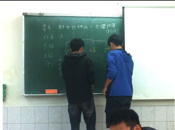
2012. 10. 30 學生上臺寫出各段落重點主旨。