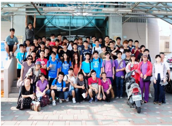
2012. 10. 14 學生在土城服務學習。