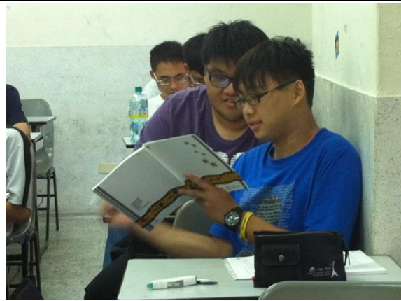
2012. 10. 07 學生討論文本問題。