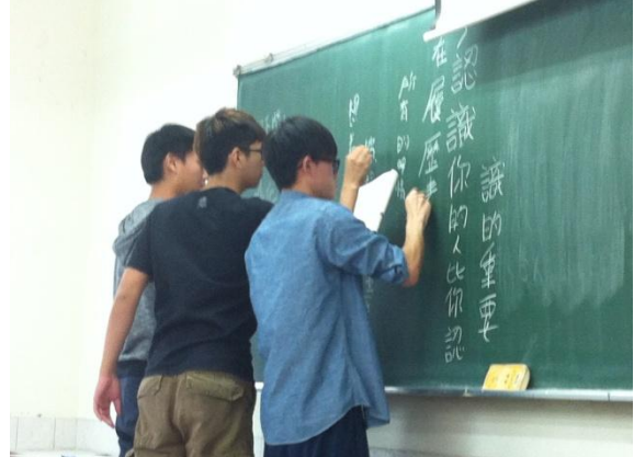
2012. 10. 21 學生上臺寫出各組的答案。