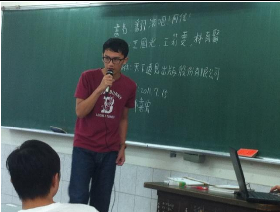
2012. 10. 28 學生進行每週一書分享。