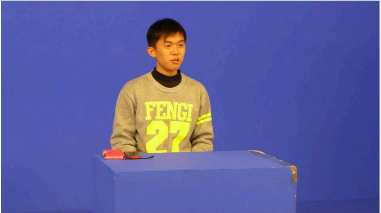
照片簡述：同學體驗上台播報。