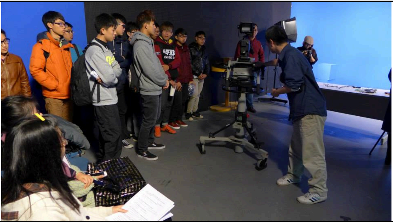
照片簡述：參觀攝影棚。