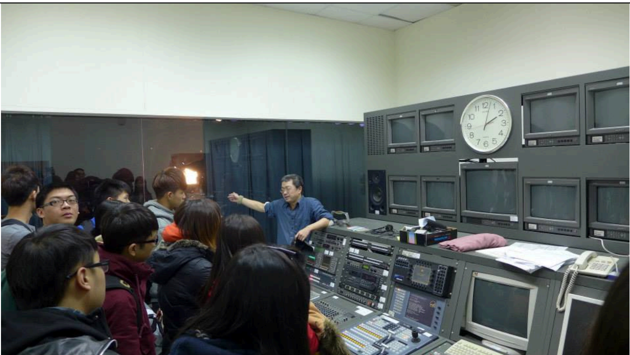
照片簡述：參觀攝影棚。