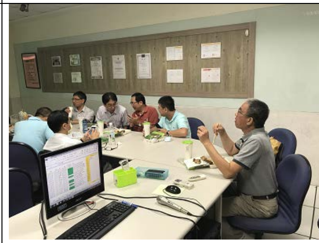
圖說：老師們針對議題進行討論