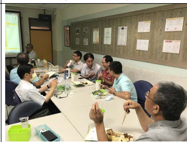
圖說：老師們針對議題進行討論