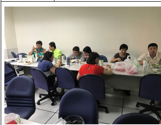
圖說：老師們用餐中