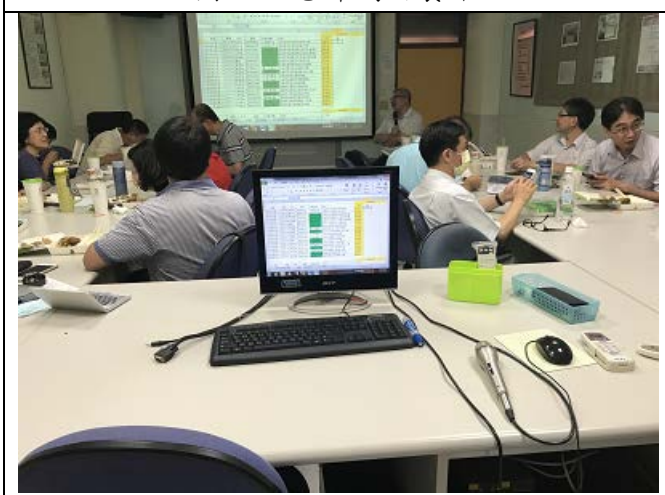
圖說：老師們針對議題進行討論