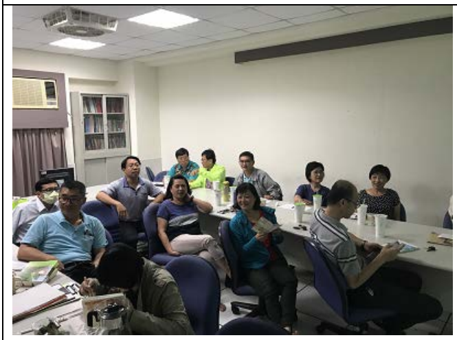
圖說：主任及老師針對議題進行討論