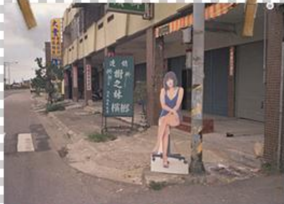
紙板西施 (游本寬-真假之間)