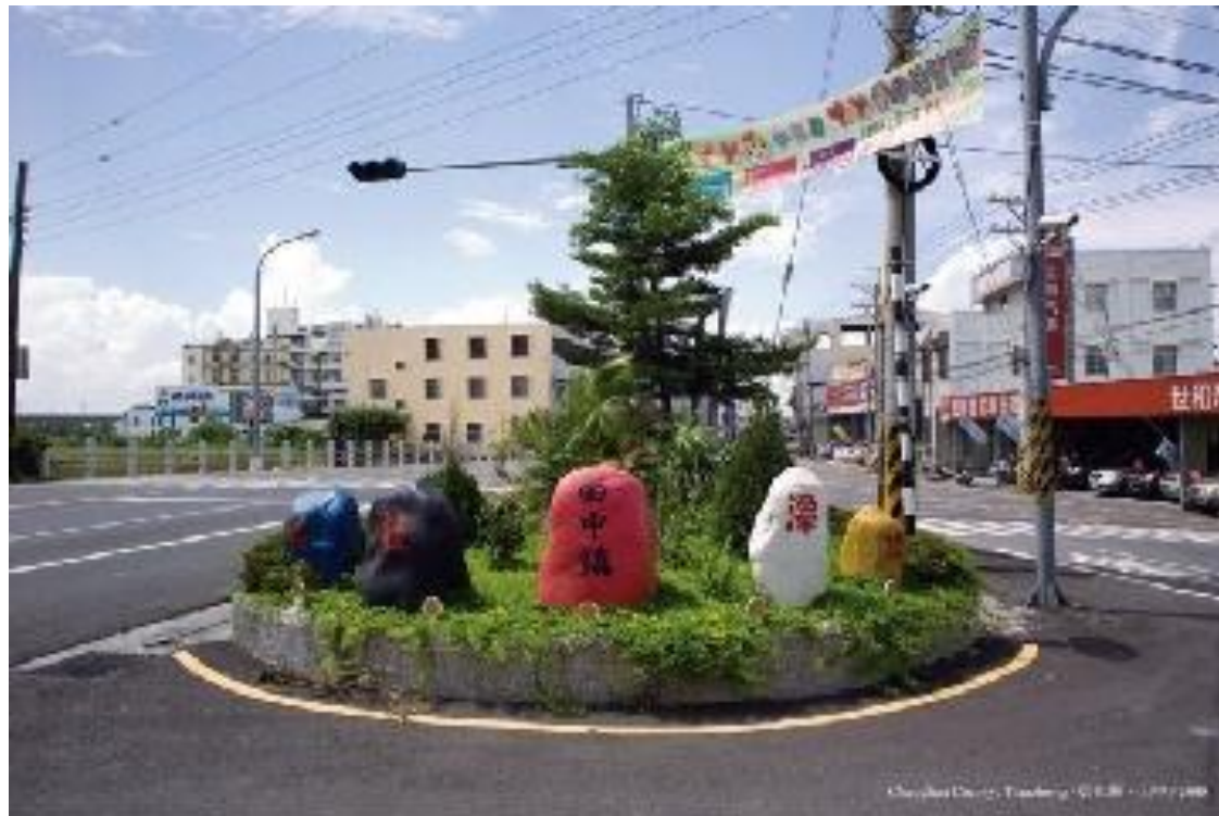
Public Art in Taiwan: Landmarks / Ben Yu