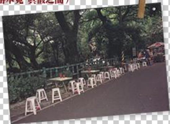
大溪中正公園內外 (游本寬-真假之間)