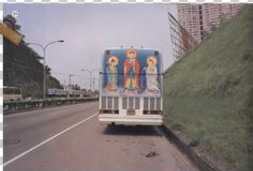
攜帶型神明 (游本寬-真假之間)